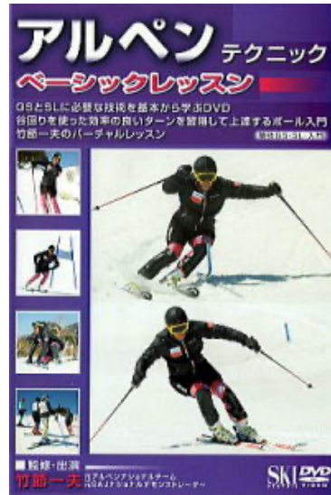
竹節先生のポール講習会参加

【期 日】 2021年12月30日(木)～2022年1月2日(日) 3泊4日 (現地朝集合・夕解散)